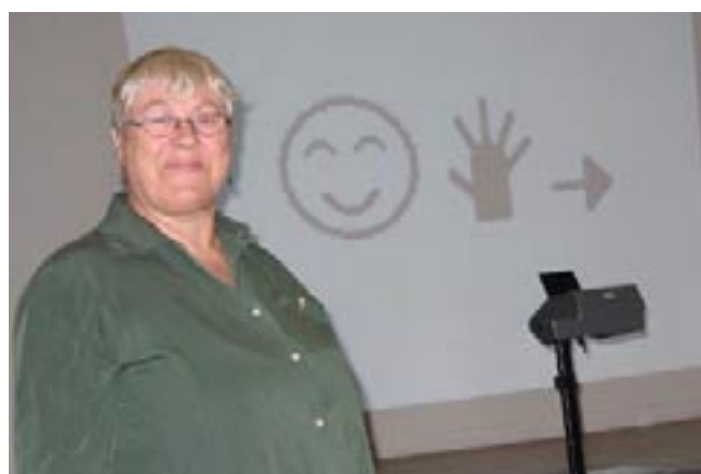
Tegnskrift på vegg viser tegnet for: "HEI"

Alle tegn i tegnskriften viser hånden din du selv ser. Hånden er "helsvart", og betyr at det er bakhånden du ser foran deg (med alle fingrene ut), og som skal beveges mot høyre. (Er hånden hvit, betyr det at du ser håndflaten foran deg - ikke håndbaken. Er hånden delt i hvit og sort, så er det siden av hånden du ser foran deg.)