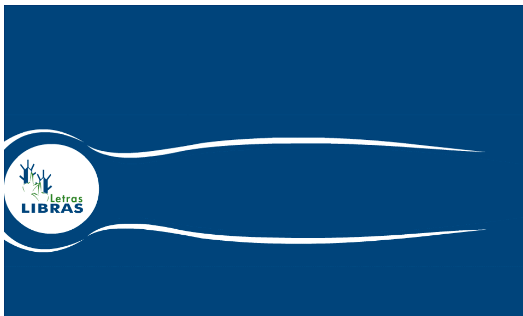
FIGURA 6 – Abertura da página do Curso de Letras Libras