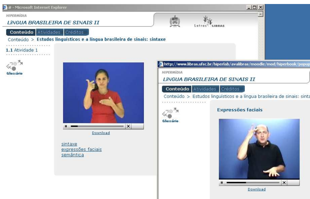
FIGURA 5 – Capas de vídeos

A decisão pela mudança da apresentação direta dos conteúdos na língua de sinais partiu da reflexão de alguns tradutores, professores fluentes na língua e designers instrucionais. Observou-se que não fazia sentido a apresentação do texto em português, uma vez que o objetivo é fazer a leitura dos textos diretamente na língua de sinais. Quando os textos estão na língua de sinais, eles passam a ser um novo texto. A tendência de alguns era verificar a correlação dos textos em português e na língua de sinais e não é este o objetivo, uma vez que a tradução da língua parte do texto em português e é recriada nesta língua. O objetivo é garantir que os conteúdos sejam apresentados na língua de sinais brasileira, sobrepondo-se ao texto motivador (inicial) que estava na versão escrita na língua portuguesa.