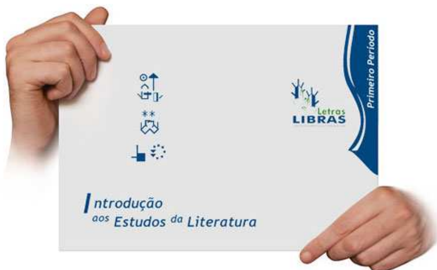
FIGURA 4 – Capa da hipermídia da disciplina

As primeiras disciplinas (figura 4) foram concluídas, após a realização de vários testes e aperfeiçoamentos. Após o primeiro bloco de implementação, foram implementadas mais onze disciplinas. Essas quinze disciplinas estão sendo revisadas e já passarão a apresentar um novo layout .